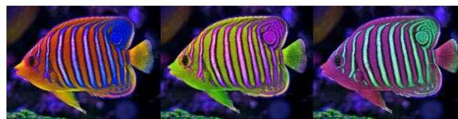
Imagen 5.- En esta fotografía se ilustra un pez corralino denominado Pygoplites diacantus (pez Angel Real). A la derecha se ilustra con sus colores naturales y al centro y a la izquierda con los tonos manipulados con el control de tonos del programa Photoshop mostrando como sobre todo en la ilustración de la derecha se pierde la armonía y en las evaluaciones que se hace ante el grupo se considera que de repente se produce una disonancia cromática como los mismos alumnos la han dado en llamar.

En este caso se inicia por reconocer combinaciones novedosas y que no coinciden con criterios convencionales.