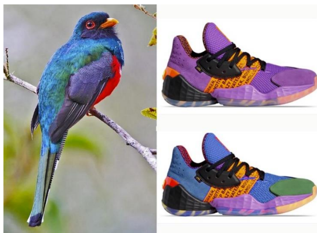
Imagen 2.- A la derecha se ilustra una fotografía de una de las aves emblemáticas de la isla de Haití llamada trogón de la española ( Priotelus roseigaster ) y a la izquierda arriba se ilustra el tenis de la marca Adidas modelo Harder en sus colores originales y en la parte inferior se ubica una modificación o manipulación digital hecha por el autor de este mismo zapato tenis pero ahora manipulando y aplicando los colores del ave tratando de coincidir el cuanto al porcentaje de áreas de aplicación y su vecindad cromática.

La creación de esta identidad puede fomentarse a través del papel del diseñador al aplicar a cualquier proyecto creativo criterios cromáticos biomiméticos y lograr un enlace entre grupos sociales con identidad reforzada a través de su coincidencia con el colorido de animales distintivos de la zona.