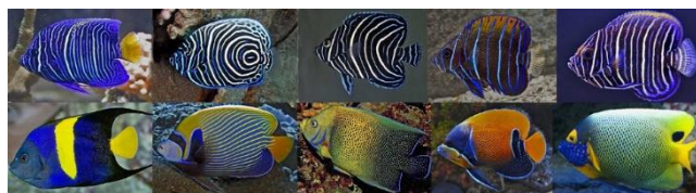
Imagen 1.- Esta serie de fotografías (reunida por el autor a partir de varias fuentes de Internet) de peces coralinos de la familia Pomacanthidae son especies muy cercanas desde el punto de vista taxonómico. De izquierda a derecha se trata de Pomacanthus asfur (Ángel Árabe), P. imperator (Ángel emperador) P. Semicirculatus, Euxiphipops (Ángel Korán), Euxiphipops Navarkus (Ángel Regal) y E. Xanthometaphon (Ángel Cara Azul). En la parte superior están las imágenes de los organismos juveniles y en la parte inferior la librea o colorido cuando son adultos. En su etapa juvenil estos peces tienen

Coloraciones de alto perfil, coloraciones de bajo perfil y coloración de distinción emblemática.