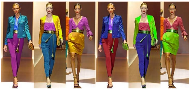
Imagen 6.- A la derecha 3 diseños de moda donde el diseñador Jan Paul Gaultier quien aplicó el precepto de colores equidistantes en el Círculo Cromático y a la derecha se recorrieron los colores con el control de tono de Photoshop y se mantiene la armonía cromática y se conserva la triada de colores.

Entre los controles de color de muchos programas digitales existe la posibilidad de alterar el tono general de los colores de manera similar a cuando se desplaza el control de tono de algunas televisiones y entonces todos los colores seleccionados de la imagen se barren hacia a derecha o la izquierda del círculo cromático.