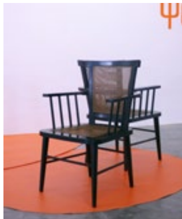
(Imagen 9) Butaca de madera tropical. Asiento y respaldo con rejilla. 53x49, 5x86, 5 cm