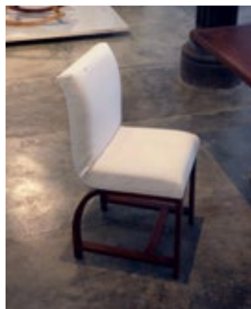
(Imagen 10) Silla de madera de caoba con acabado de barniz natural tapizado en tejido de loneta. 41x47x85 cm.