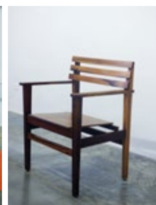
(Imagen 6) Butaca