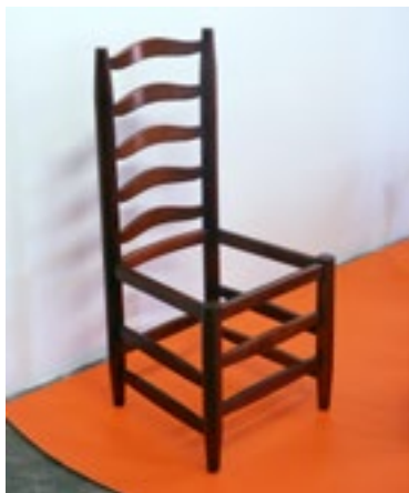
(Imagen 8) Silla de comedor. Colección Clara Luz Cabañín Roque. 44x47x82 cm.