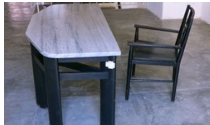
(Imagen 15) Mesa de madera tropical. Sobre de mármol gris. 150x90x75 cm. Butaca pequeña de madera tropical. 45x45x90 cm.