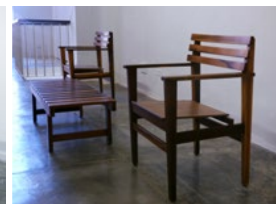
(Imagen 7) Mesa baja 118x48x37 cm.