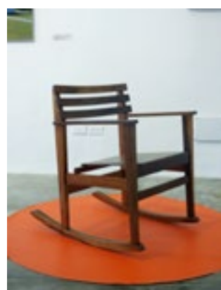
(Imagen 5) Mecedora