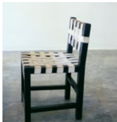
(Imagen 14) Silla de madera tropical. Asiento y respaldo con bandas. 45x45x75 cm.