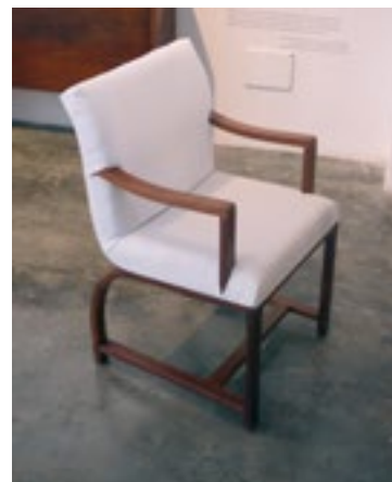
(Imagen 11) Butaca de madera de caoba con acabado de barniz natural tapizado en tejido de loneta