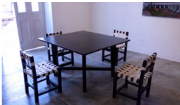
(Imagen 13) Mesa de madera tropical. 130x120x77,5 cm.