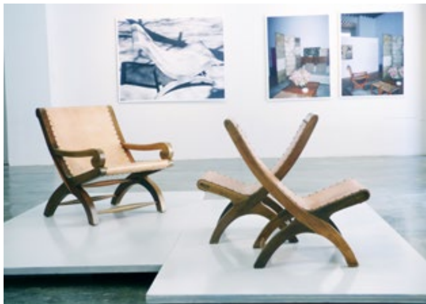
(Imagen 1) Sillón Miguelito.

La muestra formó parte de la Primera Bienal de Diseño de La Habana. Fue inaugurada el domingo 15 de mayo en la galería Factoría Habana, de la capital.