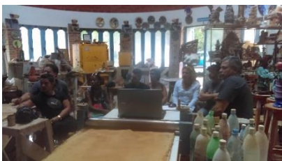
Visitan profesores del ISDi junto a los estudiantes y los instructores de Keracom con sus integrantes la Academia de arte San Alejandro y la Universidad de las Artes.