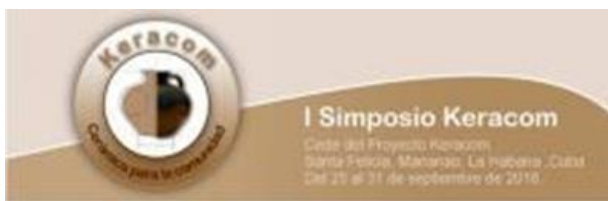
Identidad del Proyecto cultural Keracom y el I Simposio Keracom diseñados en el ISDi.