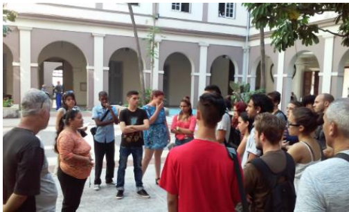
Visita de los integrantes de Keracom al ISDi donde intercambian con estudiantes y profesores.