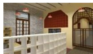
Cursos: 2015/2018 Diseño de espacios de Keracom. Práctica laboral 4to año INDUSTRIAL