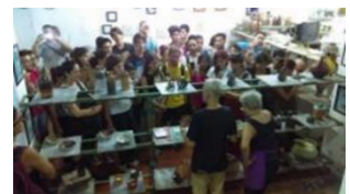
Visita de estudiantes del ISDi y del Proyecto Keracom al taller de reconocidos artistas plásticos y ceramistas.