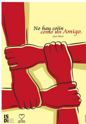
Imagen 4 Autor: Carlos Mesa

El impacto social del proyecto está dado por lo que ha representado de crecimiento espiritual para sus integrantes, así como el aporte a las comunidades, llegar desde la universidad a otras instituciones y territorios e incluso a eventos de carácter internacional que han podido apreciar diseños de carteles desde una visión de la figura y el pensamiento martiano, con la frescura y el atrevimiento de los jóvenes, pero siempre con el respeto y la veneración por el más universal de los cubanos. Desde la poesía y el diseño se aporta una mirada nueva, a veces atrevida, pero siempre respetuosa y consecuente con las ideas del Apóstol.