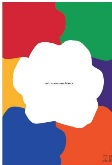
Imagen 5: Autor: Camila Berazaín

Martí. Cromáticamente se aprecia una variedad que rompe la monotonía. Los códigos en general son muy contemporáneos para lograr un mayor acercamiento del mensaje al público y elevar la posibilidad de entendimiento, de manera útil y bella.