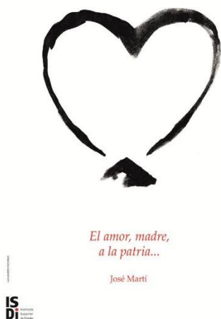
Imagen 1: Autor: Alejandro Escobar

El ISDi como Universidad del Diseño en Cuba se ha trazado a través del estudio de la vida y obra de Martí, un modelo para, desde el diseño, estimular el estudio e investigación con acciones que contribuyan a la formación de seres humanos plenos, con la capacidad de incidir en la realidad. Es prioridad también educar en el individuo el orgullo por su identidad cultural y satisfacer necesidades de la comunidad. De ahí la participación de sus integrantes en proyectos y actividades colectivas e individuales que contribuyan en la calidad de vida. Un ejemplo fehaciente es el proyecto En todas partes Soy , proyecto de carteles de estudiantes de la carrera de Diseño de Comunicación Visual.