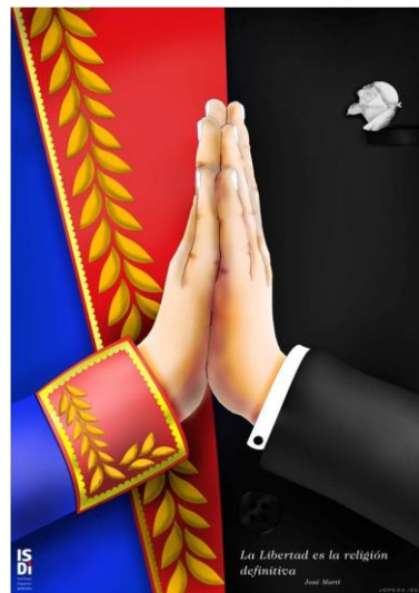
Imagen 2: Autor: José Pedro Camejo

entre las organizaciones políticas y de masas del centro en la vida del Instituto y en el cumplimiento de su responsabilidad con la sociedad.