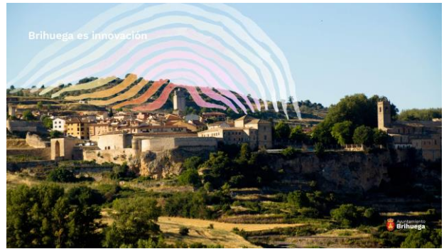
Brihuega, Guadalajara. Ilustración: Elia Mervi

Brihuega es un municipio de 2.711 habitantes formado por 11 pedanías y dos entidades menores repartidas en una extensión de 300km 2 , situado en la comarca de la Alcarria Alta, a 30 km de Guadalajara y a 86 km de Madrid por la autovía A-II. Brihuega es mundialmente conocido por sus campos de lavanda y festivales. En el año 2020 fue elegida como uno de los 15 lugares más bellos de España. En el municipio se ubican los cultivos de aromáticas más grandes de España (1.600 hectáreas). Brihuega ha creado un modelo de turismo sostenible que se ha consolidado en un Turismo de Aromáticas único en España, recibiendo más de 100.000 visitantes solo en julio y agosto que beneficia económicamente al resto de la provincia en todos los sectores.