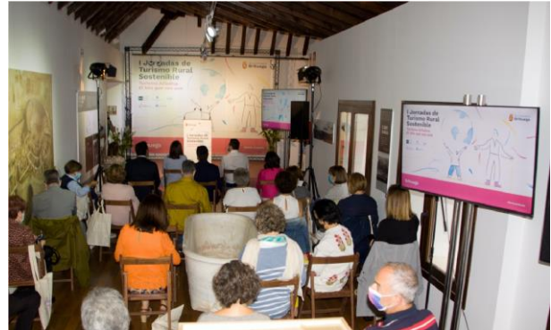
1ª Jornadas Turismo Rural Sostenible de Brihuega.

Créditos: diseño gráfico @perlitacalvario. Dirección evento: @ruraltific