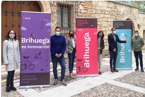
Corporación Municipal de Brihuega presentando nueva imagen de marca.

Créditos: Diseño gráfico @perlitacalvario. Foto y dirección creativa @ruraltific