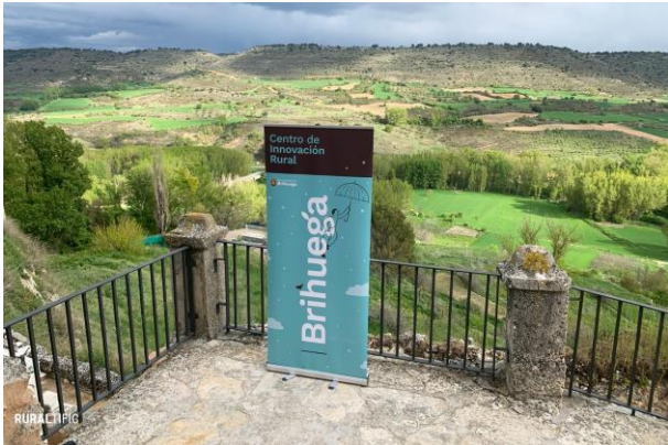
Brihuega, Guadalajara.

El proyecto “Centro de Innovación Rural” está diseñado para ser eje articulador y herramienta facilitadora de la innovación y la creatividad para las comunidades y administraciones rurales.