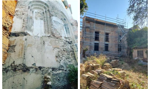
Sinagoga-Mezquita-Iglesia San Simón en proceso de rehabilitación. Sede del Centro de Innovación Rural.

FASES DEL PROYECTO (sept. 2021-mayo 2022) - Fase rehabilitación: obra civil y diseño de interiores.