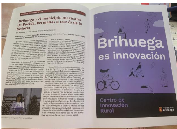
Nueva imagen de marca. Créditos diseño gráfico: @perlitacalvario. Dirección creativa @ruralitic

OBJETIVO Crear un plan de futuro para Brihuega que integre las posibilidades y oportunidades de la economía, de la tecnología, de la creatividad, desde una perspectiva de bien común que considera a las