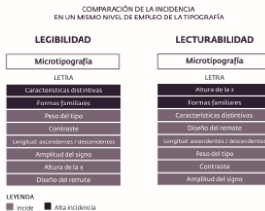
Figura 3. Comparación de la incidencia en el mismo nivel de empleo de la tipografía, la letra, para la legibilidad y lecturabilidad de los textos impresos.

Tomándose como ejemplo la letra como nivel de empleo de la tipografía y analizando los resultados obtenidos en ambos procesos se pueden ver claras diferencias