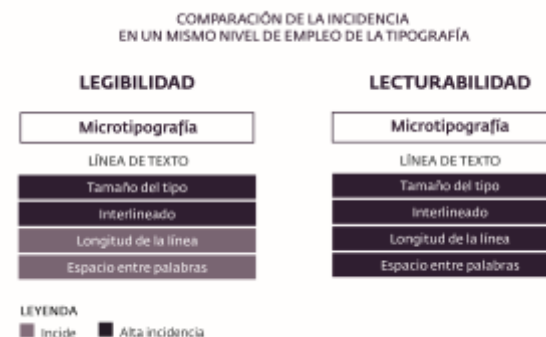
Figura 4. Comparación de la incidencia en el mismo nivel de empleo de la tipografía, la línea de texto, para la legibilidad y lecturabilidad de los textos impresos.

Si se realiza la misma operación con la línea de texto se pueden percibir los siguientes aspectos