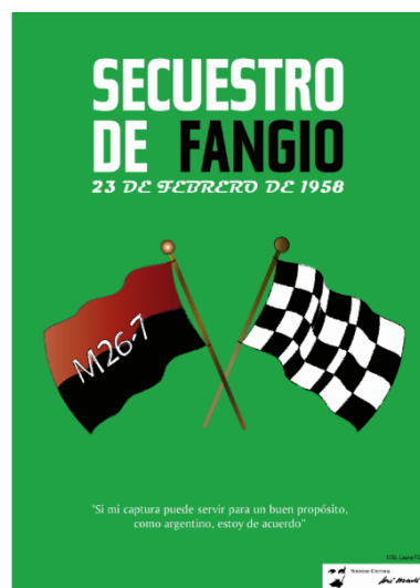
Figura 1. Cartel sobre el secuestro de Fangio en la Habana 1958.

Hemos introducido estos comentarios, pues nos interesa destacar como nuestros jóvenes diseñadores en muchos de los carteles conmemorativos realizados, han destacado los símbolos que identifican a nuestra cultura en el campo de la historia.