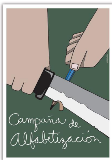
Figura 2. Cartel sobre el 55 aniversario de la Campaña de Alfabetización.

En el próximo cartel sobre la Campaña de Alfabetización, este alumno basó su composición en la representación de la mano ruda de un campesino, sacándole punta a un lápiz con el que debía aprender a escribir después de adulto, por las posibilidades que le ofrecía la Revolución, con un machete, instrumento de trabajo que devino un símbolo para el pueblo cubano por su participación en las luchas por la independencia, contra el poder español en el Siglo XIX.