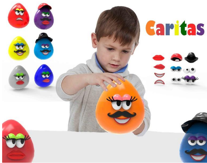
Figura 1. Juguete. Autora: Maylen Gregori Montalvo.