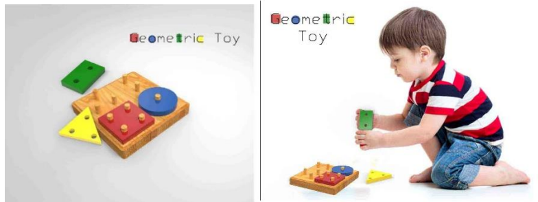
Figura 4. Juguete. Autora: Liana Pila.