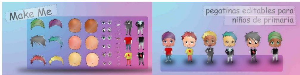
Figura 2. Juguete. Autor: Gabriel Rodríguez.