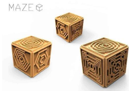
Figura 6. Juguete. Autor: Eduardo Díaz Gómez.