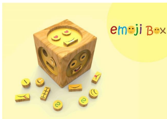
Figura 3. Juguete. Autora: Melisa Laura Aguilar Fuentes.